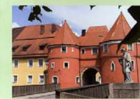
Blertor in Cham

Der Radweg von Regensburg bis zur Grenze bei Furth im Wald verläuft bis Cham auf dem Regental-Radweg, meist entlang des Regenflusses. Er bietet wegen seiner geringen Steigungen genussvolles Radeln durch eine ursprüngliche Flusslandschaft. Burgen und Schlösser sowie zahlreiche Kirchen und Klöster laden zu kleinen Abstechern ein.