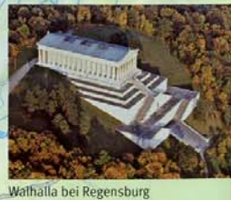
Walthalla bei Regensburg

Radwege-Beschilderung in Bayern: Grünes Fahrrad auf weißem Grund, Name des Weges und Richtungspfeil – so sollten Sie eigentlich immer auf der richtigen Spur sein. Mehr dazu auch unter www.bayerninfo.de