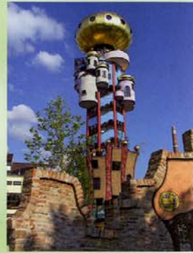
Kuchlbauer Turm Abensberg

in der Natur. Die Isarradweg-Beschilderung führt über Freising nach Marzling über den Abens-Radweg. Dieser Teil der Strecke verläuft durch das größte zusammenhängende Hopfenanbaugebiet der Welt – die Hallertau – und bietet die einmalige Kulisse von Hopfengärten. Quer durch diese ländliche Kulturlandschaft Altbayerns gelangen Sie über Abensberg hinter Bad Gögging an die Donau, unweit