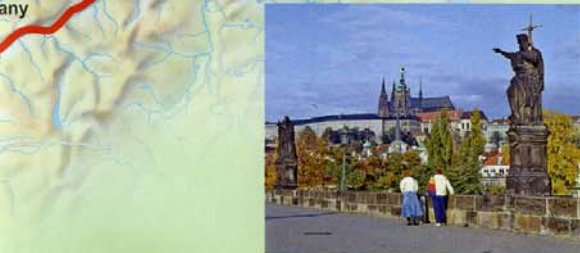
Auf der Karlsbrücke in Prag