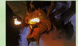
Drachenstich, Furth im Wald

Ab der alten Handelsstadt Cham wechselt man auf den Chamtal-Radweg bis Furth im Wald. Hinter der Drachenstich-Stadt Furth im Wald überqueren wir beim Grenzübergang Schafberg/Ovci vrh die Grenze nach Tschechien. Jetzt werden die Berge links und rechts höher und Sie