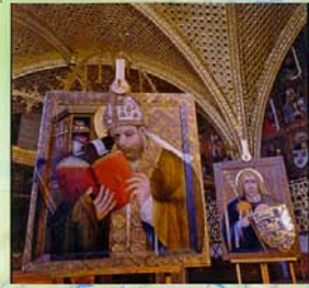
Museum Burg Karlstein

Bildnachweis: Titelbild „Radler in Regensburg“ sowie Walthalla: Regensburg Tourismus GmbH Rücktitel: „Radler vor Kloster Reichenbach“, Landratsamt Cham Kloster Weltenburg: Tourismusverband im Landkreis Kelheim e.V.