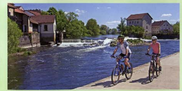
Radler am Regen

Informationen, Kartenmaterial und Zimmerreservierung für eine 5- oder 8-tägige Radtour von München nach Prag bietet Ihnen: Reisebüro Wolff, c/o Hermann Plötz, Bahnhofstraße 20, D-93437 Furth im Wald, Tel. 09973 8012094, Fax 03212 1055987 hermann.ploetz@web.de