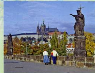
Auf der Karlsbrücke in Prag